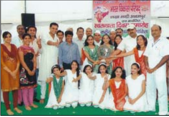
1 st V.M. Vishvas school, 2 nd Northern International School.